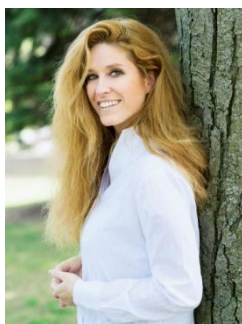
Jeff Mangione © Loewe Verlag GmbH

Jona ist siebzehn und seinen Altersgenossen ein ganzes Stück voraus, was Intelligenz und Auffassungsgabe betrifft. Allerdings ist er auch sehr talentiert darin, sich bei anderen unbeliebt zu machen und anzuecken. Auf die hervorgerufene Ablehnung reagiert Jonas auf ganz eigene Weise: Er lässt sein privates Forschungsobjekt auf seine Neider los: eine Drohne. Klein, leise, mit einer hervorragenden Kamera ausgestattet und imstande, jede Person aufzuspüren, über deren Handynummer Jona verfügt. Mit dem, was er auf diese Weise zu sehen bekommt, kann er sich zur Wehr setzen gegen Spott und Häme. Doch dann erfährt er etwas, das besser unentdeckt geblieben wäre, und plötzlich schwebt er in tödlicher Gefahr.